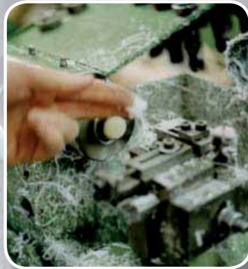
Bearbeitung des Rohlings bis zur endgültigen Knopfform